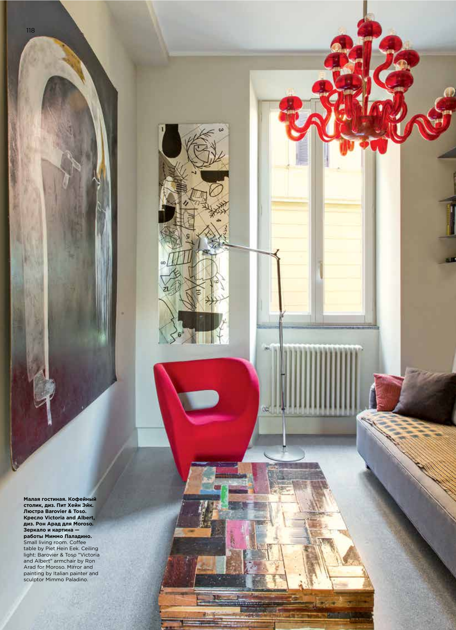
Малая гостиная. Кофейный столик, диз. Пит Хейн Эйк. Люстра Barovier & Toso. Кресло Victoria and Albert, диз. Рон Арад для Moroso. Зеркало и картина — работы Миммо Паладино. Small living room. Coffee table by Piet Hein Eek. Ceiling light: Barovier & Toso "Victoria and Albert" armchair by Ron Arad for Moroso. Mirror and painting by Italian painter and sculptor Mimmo Paladino.

Интерьер отражает любовь своей хозяйки к ремеслу и истории, продолжает атмосферу ее галереи Mia Gallery.