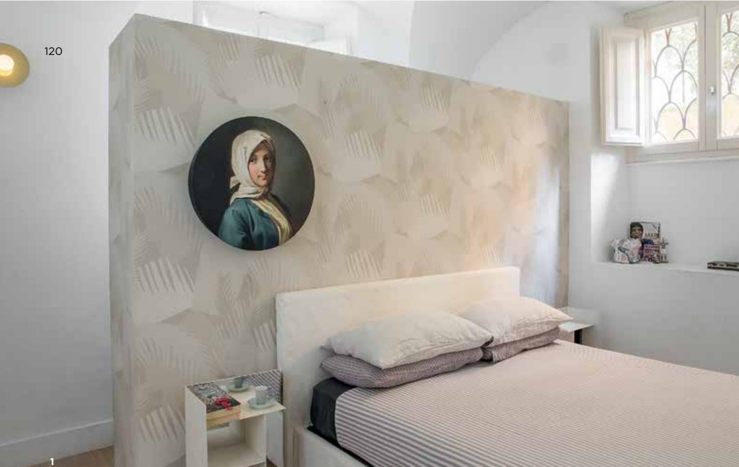
1. Главная спальня. Обои Cole & Son. Настенный светильник Donne Illuminate. Керамическая ваза Рейналдо Сангино (участник проекта EDIT Napoli). Прикроватные тумбы спроектировала хозяйка дома, Бра Atelier Areti. 2. Смесители Fantini, дизайн навеян оснащением старых госпиталей. 3. Кухонную мебель спроектировала архитектор Марианна Лубрано Лавадера. На столе керамика Wonki Ware и изделия неизвестных африканских мастеров.