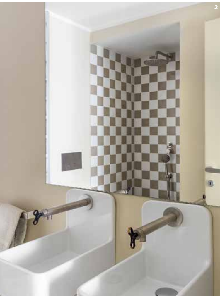
1. Master bedroom. Wallpaper: Cole & Son. Wall light: Donne Illuminate. Ceramic vase by Reinaldo Sanguino (participating in EDIT Napoli). Night tables designed by Emilia Petruccelli. Applique by Atelier Areti. 2. Handbasin and taps Fantini are inspired by old hospitals fittings. 3. Kitchen designed by architect Marianna Lubrano Lavadera. Plates on the table by Wonki Ware and by African unknown artisans.